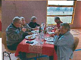
Repas des Seniors le 21 novembre